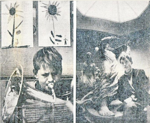
I Vejengarden truttet der af hjertens lyst. Der er stor efterspørgsel på de dygtige drenge.

Dette var blot en slags portræt på den by, Politiken har vurderet som årets levende by, selv om ingen turistmand ville drømme om at kalde den "Sydjyllands Perle". Der findes jo i øvrigt så mange former for perler.