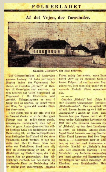
Gaarden „Birkely“, der skal nedrives.