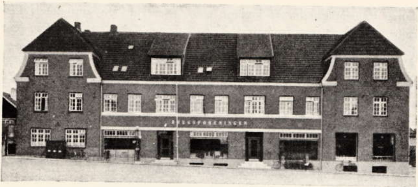
VEJEN NYE BRUGSFORENING

Stilling formindske Købmændenes Udsigter i ret høj Grad, og de to Høkere, som nævntes ovenfor, forsvandt da ogsaa efter kort Tids Forløb.