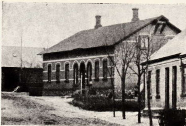
VEJEN GAMLE BRUGSFØRENING

Vejen Brugsforening . Naar det, som foran nævnt, varede 10 Aar fra Stationens og Jernbanens Anlæg før der kom en virkelig levedygtig Købmandsforretning ved Vejen Station (Karmarks), skyldes det for en stor Del Brugsforeningen . Helt fra 1872 havde den forsynet en stor Del af Sognets og Omegnens Husholdninger, foreløbig dog væsentlig med Kolonialvarer. Tidlig indsaa Bestyrelsen, at naar der skulde bygges, saa skulde det være ved Stationen, og allerede 1875 begyndte man her i eget Hus. Da der dengang var 119 Med-