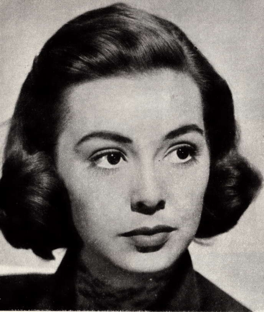
B ARBARA RUSH er født 4/1 1927 i Denver, Colorado. Øjne: Kastaniebrune. Haar: Sort. Højde: 1,70 m. Spiller Hovedrollen i Storfilmene »The Black Shield of Falworth« m. Tony Curtis og Janet Leigh, og i »Captain Lightfoot« optaget i Irland m. Rock Hudson.