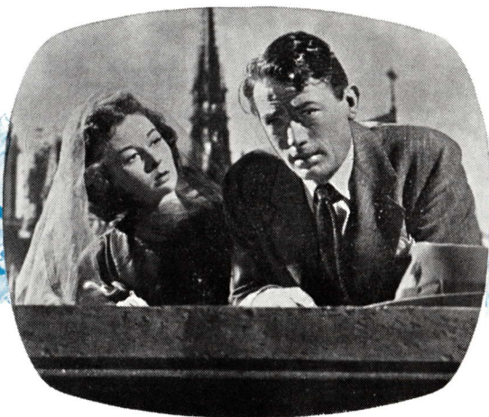
„Er De ikke Harry Street?“ Susan Hayward, Gregory Peck.

Harry vaagner op af sin død, mørket er faldet paa, og en hekse-doktor kommer for at blande noget medicin til ham, men Helen ser, at der maa gøres noget effektivt og skærer betændelsen ud af hans ben med en kniv. Harry bliver bevidstløs, men efter en frygtelig nat hører de endelig om morgenen den ventede flyve-maskine, der skal bringe dem bort fra Kilimanjaro mod frelse og ny forstaaelse af hinanden.