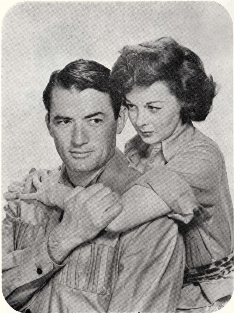
Gregory Peck, Susan Hayward.