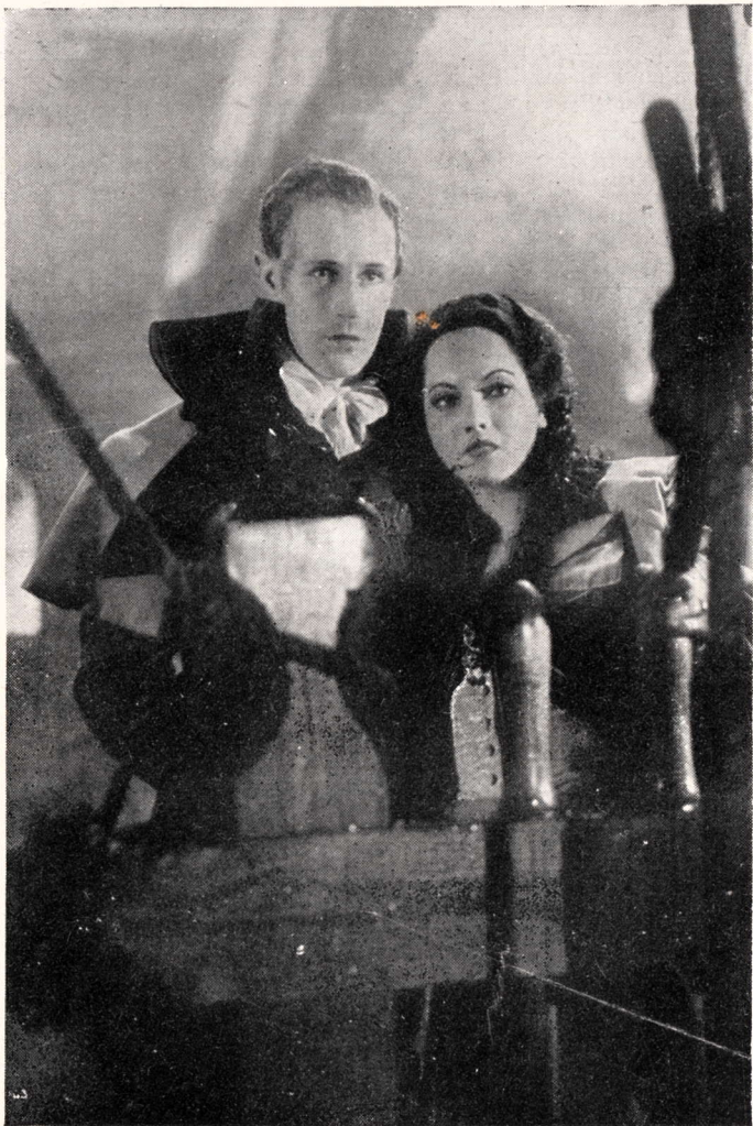
Leslie Howard og Merle Oberon