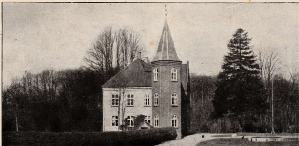
AARHUS AMT, Voer Herred, Havreballegaard. Side 290.

Enhver praktisk Landmand har Brug for „Danske Gaarde“! Ikke alene ved Ejendomshandel og Forpagtning kan Værket være ham til største Nytte, men ofte vil det kunne yde god Vejledning, hvis en Søn eller Datter søger Plads i en anden Egn af Landet, for ikke at tale om de mangfoldige Tilfælde, hvor det ved Udveksling af Saasæd, Ombytning af Stamdyr o. s. v. kan give betydningsfulde Vink. Dertil kommer den Værdi, der ligger i dette, gennem Værkets detaljerede Oplysninger at være i Stand til at drage Sammenligning mellem egen og andres Bedrift. I dette Moment findes en Løftestang, som enhver fremadstræbende, dygtig Landmand vel skal vide at drage Fordel af. Og endelig er Læsningen af det smukke, rigt illustrerede Værk en underholdende Nydelse af høj Rang for enhver, der har Kærlighed til det danske Landbrug.