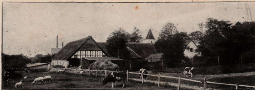
AARHUS AMT, Ning Herred, Lundshøjgaard. Side 128.