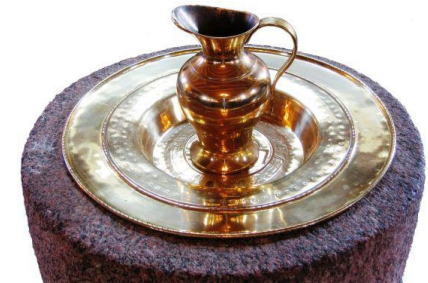
Døbefont fra slutningen af 1200-tallet med dåbsfad fra o. 1550