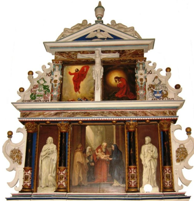
Vejen gamle kirkes altertavle fra 1606 opsat i den sydlige korsarm i den nye kirke