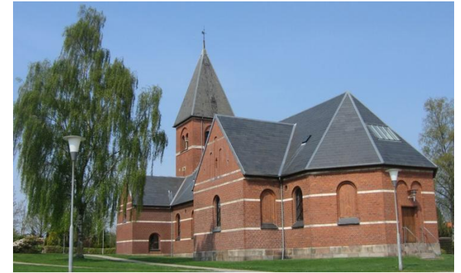
Den ny kirke set fra øst