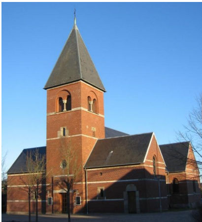
Vejen ny Kirke - opført 1896 - set fra vest